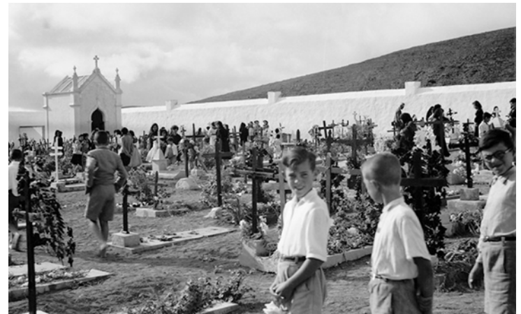
Cementerio de Haría, 1954.