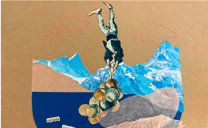
© Lucía Corrochano, alumna del taller "El collage viajero que escribe versos"