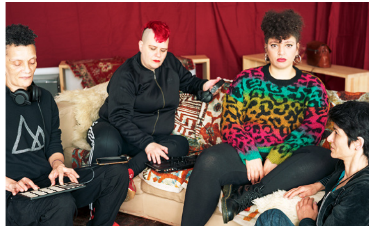
Las nietas del Lyceum o Tertulia, 2020. © Carmela García

Organiza Centros de Arte, Cultura y Turismo del Cabildo de Lanzarote