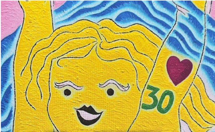
Imagen de Tayó. Fragmento

Entrada libre y gratuita Organiza Cabildo de Lanzarote