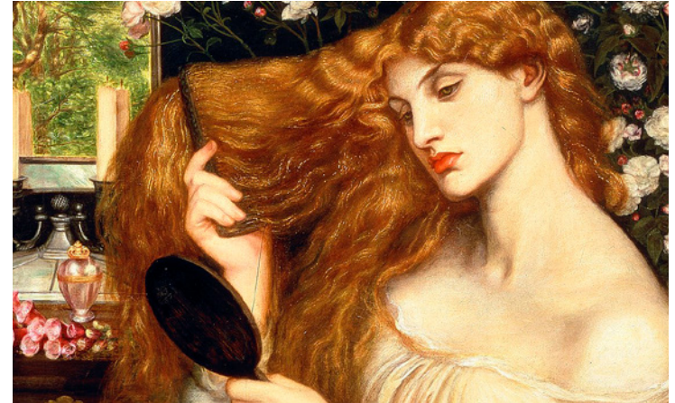
En la imagen: Lady Lilith de Dante Gabriel Rossetti (fragmento)

Entrada libre y gratuita Organiza Cabildo de Lanzarote