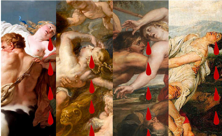
“El Rapto” collage de Emma LLG

Entrada libre y gratuita Organiza Cabildo de Lanzarote