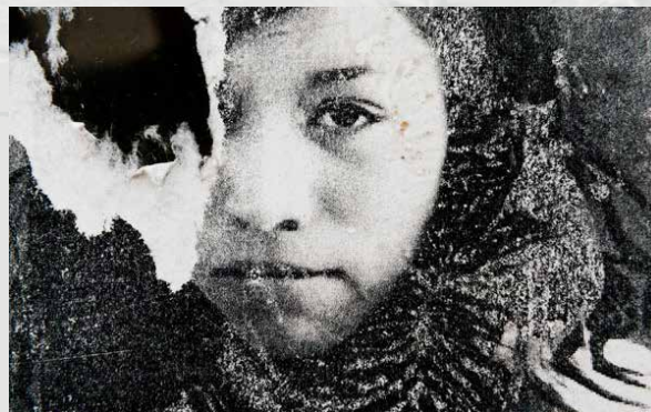
Pesquisas, 2016 Teresa Margolles (fragmento)

Organiza Centros de Arte, Cultura y Turismo del Cabildo de Lanzarote